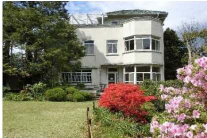
小田原文学館別館