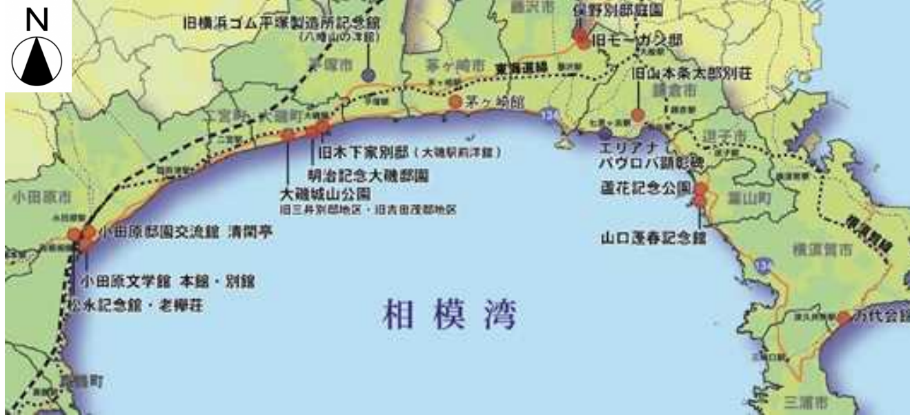
明治記念大磯邸園（整備中）