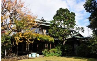
松永記念館・老櫓荘