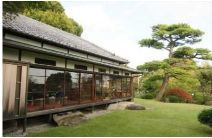
小田原文学館本館