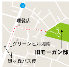
旧モーガン邸 藤沢市大鋸1122 JR藤沢駅北口バス乗り場5番より乗車「緑ヶ丘」下車徒歩4分

時間 10:00～16:00 (三日間とも) 会場 旧モーガン邸庭園 参加費 入場無料 (ワークショップは500円～1000円程度) ※作品の販売もいたします。収益は全て再建募金となります。 申込み& 問い合わせ メール・FAX・電話にて申し込み mail:1122morganhouse@gmail.com tel/fax:0466-25-2076 主催 NPO法人旧モーガン邸を守る会 共催 (公社)横浜歴史資産調査会 後援 藤沢市教育委員会