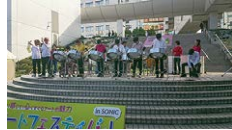
スティールパンバンド