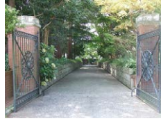
旧モーガン邸アプローチ