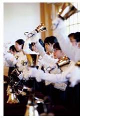
聖園女学院 聖歌隊ハンドベル・クワイア