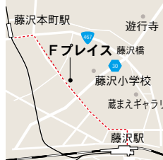
Fブレイス (藤沢市労働会館) 小田急藤沢本町駅より徒歩10分 JR藤沢駅北口より徒歩15分

時間 14:00～16:30 (13:30開場) 会場 Fブレイス (藤沢市労働会館) ホール 参加費 全席指定 2,300円 定員 200名 申込み& 問い合わせ メール・FAX・電話にて申し込み mail:1122morganhouse@gmail.com tel/fax:0466-25-2076、0466-82-0982 主催 NPO法人旧モーガン邸を守る会 共催 (公社)横浜歴史資産調査会 後援 藤沢市教育委員会/湘南邸宅文化ネットワーク協議会/湘南藤沢文化ネットワーク(一社)神奈川県建築士会湘南支部