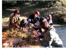
庭園でのリースづくり