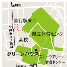
グリーンハウス 藤沢市善行7-1-2県立体育センター内 小田急江ノ島線善行駅東口より徒歩10分

時間 12:30～16:30 グリーンハウス見学会 12:30～ ミニコンサート 14:00～ 記念講演 14:45～ 会場 県立スポーツセンター「グリーンハウス」 参加費 700円 (資料、保険を含む) 定員 50名 (申込先着順) 申込み mail:a.mac@jcom.home.ne.jp 問い合わせ 090-5427-8033 (渥美) 主催 善行雑学大学