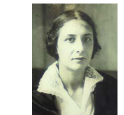
エアアナ・パヴロバ