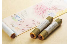
『絵巻 万葉ものがたり』の一部