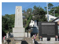
腰越戦没者慰霊碑

時間 13:00～15:30 集合場所 江ノ電七里ヶ浜駅東側改札前 参加費 1,000円 定員 15名 (申込先着順) 申込み mail: inadxaxx@yahoo.co.jp 問い合わせ tel: 0467-32-1650 (稲田) 主催 鎌倉邸園文化クリエイション 共催 鎌倉パヴロバ会