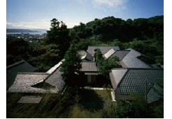
旧山本条太郎別荘