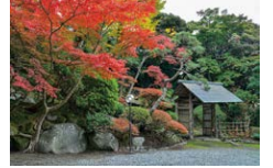
旧山本条太郎邸 前庭