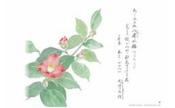
万葉野の花卓上カレンダー2024の一部