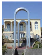
エアアナ・パヴロバ 顕彰碑

横浜市中区山手町254 みなとみらい線・アメリカ山公園口より徒歩3分 JR石川町駅南口より徒歩15分