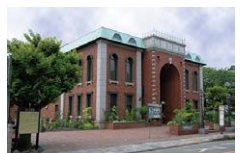
岩崎博物館 (ゲーテ座記念)

横浜市中区山手町254 みなとみらい線・アメリカ山公園口より徒歩3分 JR石川町駅南口より徒歩15分