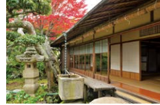
旧山本条太郎邸 大広間

時間 10:00～16:00 (15時までに入館) 会場 旧山本条太郎邸別荘 (神霊教鎌倉鎌成場「霊源閣」) 入場料 500円 定員 各日100名 (当日先着順) 問い合わせ tel: 080-3084-4837 (長谷の会・山口) 主催 長谷の会 共催 (宗)神霊教鎌倉鎌成場、鎌倉邸園文化クリエイション