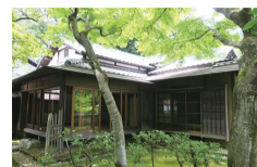
松永記念館 老櫻荘