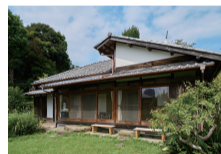
NHK連続テレビ小説『虎に翼』ゆかりの地でもある甘柑荘