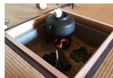
大炉と北側の縁側に水屋を備える