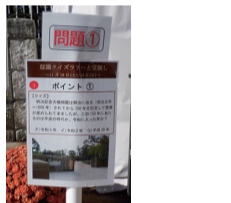
邸園クイズラリー