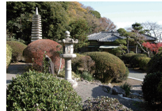
旧安田善次郎邸 母屋・十三重塔