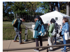
邸園クイズラリー

時間 9:00~16:30 (開園時間) 会場 明治記念大磯邸園 参加費 無料 問い合わせ tel:0463-61-0101 主催 公益財団法人神奈川県公園協会