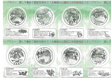
スタンプラリー用紙

時間 9:00~16:00 会場 大磯城山公園旧三井別邸地区・旧吉田茂邸地区 参加費 無料 問い合わせ tel:0463-61-0355 (大磯城山公園管理事務所) 主催 神奈川県公園協会・湘南造園グループ