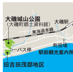
大磯城山公園 大磯町国府本郷551-1 JR大磯駅からバス1番または2番乗場より乗車約7分、「城山公園前」下車徒歩3分

時間 9:00~17:00 会場 大磯城山公園旧吉田茂邸地区 兜門周辺 入場料 無料 問い合わせ tel:0463-61-0355 (大磯城山公園管理事務所) 主催 神奈川県公園協会・湘南造園グループ