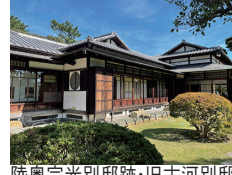
陸奥宗光別邸跡・旧古河別邸