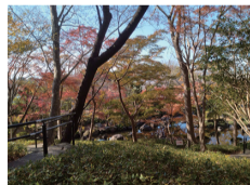
城山公園不動池付近