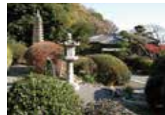
旧安田善次郎邸 母屋・十三重塔