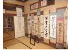
墨跡風入れ展示風景

時間 10:00~16:00 会場 盛岩寺昭和文芸館 参加費 無料 問い合わせ tel:0466-48-5653 主催 盛岩寺昭和文芸館 協力 盛岩寺緑風会