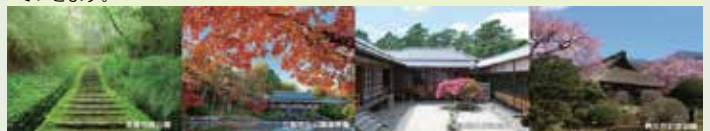
「皇室ゆかりの庭園」

湘南邸園文化祭連絡協議会は、国土交通省が実施する「ガーデンツーリズム登録制度」に『湘南邸園文化ツーリズム』として令和元年度に登録されています。当協議会は、神奈川県内の邸園文化の普及活動に取組んでいます。この邸園文化に関連する取組として『富士・箱根・伊豆「皇室ゆかりの庭園」ツーリズム』があります。離宮や御用邸、別荘には建物に付随して美しい庭園が整備され、現在では魅力的な観光資源として4つの構成庭園が連携して魅力発信に取組んでいます。『湘南邸園文化祭2024』では、恩賜箱根公園と明治記念大磯邸園、大磯城山公園の3会場での「ざる菊」の展示を同時開催。連携した取組を通じ、広域的な魅力発信を図っていきます。