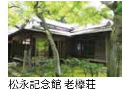
甘柑荘 古稀庵 松永記念館 老樺荘