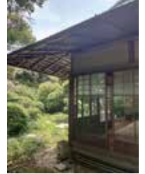
旧山本条太郎別荘 (客間)