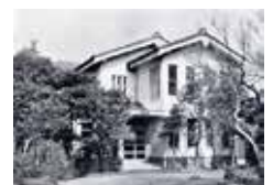
旧鎌倉図書館 古写真