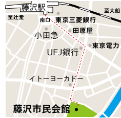
藤沢市民会館 藤沢市鶴沼東8-1 JR藤沢駅南口より徒歩10分