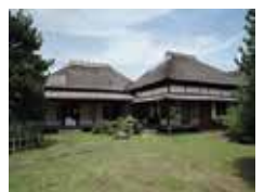
万代会館(前庭より)

市立万代会館 横須賀市津久井2-15-33 京急津久井浜駅より徒歩5分 ※施設内の駐車場は使用できません。 ※万代会館へは入室不可、見学は庭園から。