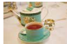
アフタヌーンティー

時間 14:00~16:00 会場 八幡山の洋館 参加費 500円(紅茶の試飲、クッキー付き) 定員 15名(先着順) 申込み ※申込方法は右下参照 問い合わせ tel:0463-35-7114 主催 八幡山の洋館