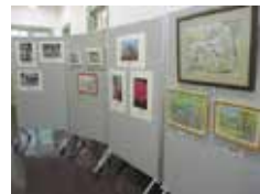
洋館とバラの写真・絵画展示

募集期間 10 | 12 | 土 | ~ 27 | 日 | 展示期間 10 | 22 | 火 | ~ 11 | 3 | 祝・日 | 展示時間 14:00~16:00 会場 八幡山の洋館 入場料 無料 問い合わせ tel:0463-35-7114 主催 八幡山の洋館