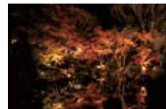
もみじライトアップ

時間 16:30~20:00 (ライト点灯時間) 会場 県立大磯城山公園旧三井別邸地区 茶室・不動池・もみじの広場 入場料 無料 問い合わせ tel:0463-61-0355 (大磯城山公園管理事務所) 主催 神奈川県公園協会・湘南造園グループ