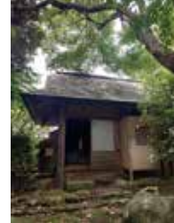
旧山本条太郎別荘 (茶室)