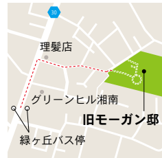
旧モーガン邸 藤沢市大鋸1122 JR藤沢駅北口バス乗り場5番より乗車「緑ヶ丘」下車徒歩4分