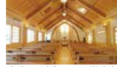
宮大工が造った聖堂内部