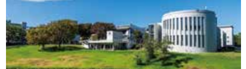
SFCのキャンパス ( https://www.sfc.keio.ac.jp )