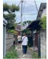
狭い路地にたくさんのお客様!