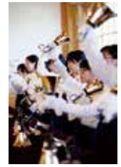
聖歌隊ハンドベル・クワイア