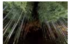
竹林ライトアップ