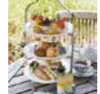
アフタヌーンティー