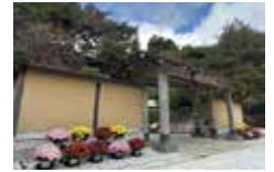
ざる菊(中央門付近)

県立恩賜箱根公園 JR・小田急小田原駅から箱根町港行きバス乗車「恩賜公園前」下車