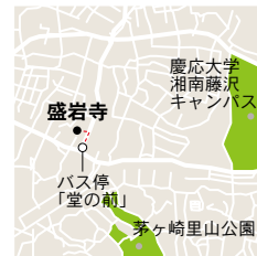
盛岩寺昭和 culture 館

湘南台駅西口からバス4番19系慶応大学・宮原経由綾瀬車庫行、辻堂駅北口より綾瀬車庫行き「堂の前」下車徒歩3分。(いずれも本数少なく事前に時間の確認が必要です。Pあり)