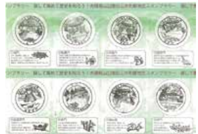
スタンプラリー用紙

時間 9:00~16:00 会場 大磯城山公園旧三井別邸地区・旧吉田茂邸地区 参加費 無料 問い合わせ tel:0463-61-0355 (大磯城山公園管理事務所) 主催 神奈川県公園協会・湘南造園グループ