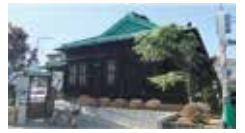
鶴沼橋市民の家 (旧後藤医院)