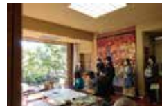
吉田五十八設計の画室

時間 ①11:00～12:00、②13:30～14:30 会場 山口蓬春記念館 参加費 無料(但し、当日の入館料は別途必要) 定員 各回10名(先着順) 申込み 開始10分前までに正門前にご集合ください。 問い合わせ tel:046-875-6094(山口蓬春記念館) 主催 山口蓬春記念館・公益財団法人JR東海生涯学習財団