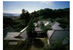
旧山本条太郎別荘

旧山本条太郎別荘 (神霊教鎌倉錬成場「霊源閣」) 鎌倉市長谷3-2-11 江ノ電長谷駅より徒歩8分