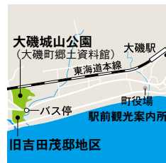
大磯城山公園 大磯町国府本郷551-1 JR大磯駅からバス1番または2番乗場より乗車約7分、 「城山公園前」下車徒歩3分

時間 9:00~17:00 会場 大磯城山公園旧吉田茂邸地区 兜門周辺 入場料 無料 問い合わせ tel:0463-61-0355 (大磯城山公園管理事務所) 主催 神奈川県公園協会・湘南造園グループ