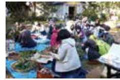
リース作りの様子

時間 11:00~14:30 (随時受付) 会場 旧モーガン邸庭園 イベント広場 参加費 1,000円(ひとつ作れます) ※材料がなくなり次第終了 問い合わせ mail:1122morganhouse@gmail.com 主催 NPO法人旧モーガン邸を守る会