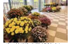
ざる菊(湖畔展望館内)