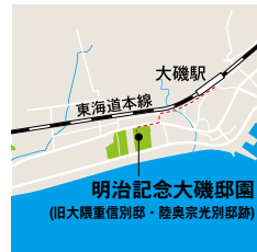
明治記念大磯邸園 大磯町東小磯295 JR大磯駅から徒歩15分

時間 9:00~16:30 (開園時間) 会場 明治記念大磯邸園 入園料 無料 問い合わせ tel:0463-61-0101 主催 公益財団法人神奈川県公園協会