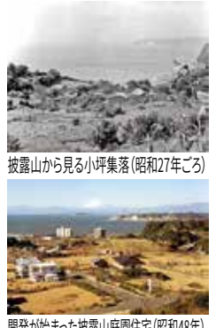
披露山から見る小坪集落(昭和27年ごろ)

小坪漁港 天王浜 JR鎌倉駅東口より「逗子郵便局行」乗車、「小坪」下車徒歩11分 京急逗子・葉山駅より「逗子郵便局行」乗車、「小坪海岸」下車徒歩1分