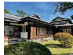
陸奥宗光別邸跡・旧古河別邸