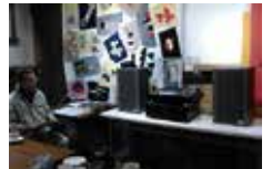
レコードかふえのようす