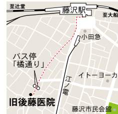
旧後藤医院 藤沢市鶴沼橋1-14-7 JR藤沢駅南口より徒歩6分

時間 ①建物見学と解説 13:30~14:00 ②レコードかふえ 14:15~15:45 会場 鶴沼橋市民の家 (旧後藤医院) 参加費 500円 (コーヒー・菓子付き) 定員 25名 (申込先着順) 申込み mail:sfbunkanw@gmail.com 問い合わせ tel:090-3205-2091 (伊澤) 主催 湘南藤沢文化ネットワーク