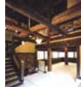
移築部材を組み込んだ内観