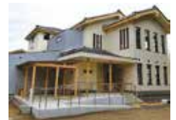
旧鎌倉図書館 修復後