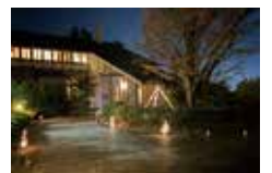
俣野別邸の竹あかり