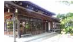
旧越前屋雨谷商店全景