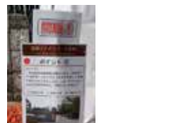
邸園クイズラリー