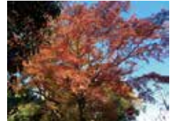
俣野別邸庭園のモミジ