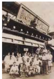
昭和10年頃の玉屋本店