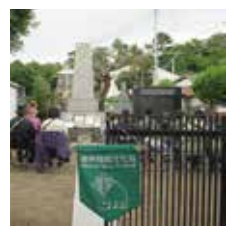
腰越戦没者慰霊碑