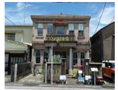
朝倉邸 - 菓膳喫茶 KURA

「朝倉邸」は、昭和初期に左官屋の棟梁が建てた和洋折衷の自邸である。2023年9月に「菓膳喫茶 KURA」として活用された。喫茶店として一部改変を加えながらも、外観や玄関、二階などはよく当時の姿を残している。漆喰天井などには左官の技が光っている。