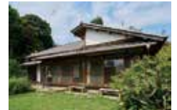
NHK連続テレビ小説『虎に翼』ゆかりの地でもある甘柑荘