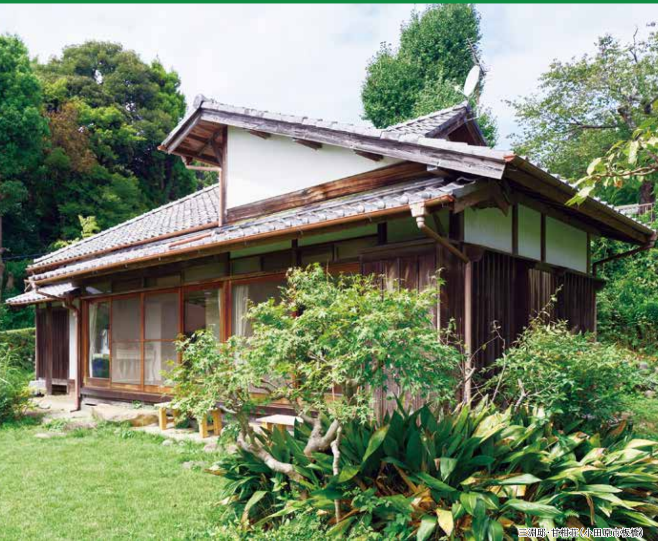
三淵邸・柑柑荘(小田原市板橋)

湘南の緑豊かで閑静なお屋敷とアートが融合した新しい空間が出現。 秋の一日、湘南の街を散策し、新しい魅力を発見しませんか。