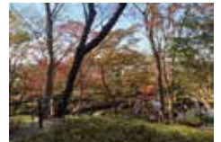
城山公園不動池付近