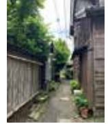
昔懐かしい堀の街角