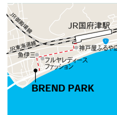
BLEND PARK 小田原市国府津2-6-17 JR国府津駅より徒歩6分

時間 10:00～16:00 会場 BLEND PARK 参加費 各イベントごと 申込み パレード参加者のみ申込みが必要になります。 yahho.kouzu.murayakuba@gmail.com 主催 ヤッホー国府津村役場 後援 小田原市