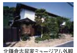
北鎌倉古民家ミュージアム外観