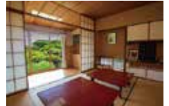
山口蓬春記念館 茶の間

山口蓬春記念館 JR逗子駅よりバス3番乗り場 海岸回り「葉山」行き乗車、バス停「三ヶ丘・神奈川県立近代美術館前」下車 徒歩2分 URL https://www.hoshun.jp/