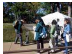
邸園クイズラリー

時間 9:00~16:30 (開園時間) 会場 明治記念大磯邸園 参加費 無料 問い合わせ tel:0463-61-0101 主催 公益財団法人神奈川県公園協会