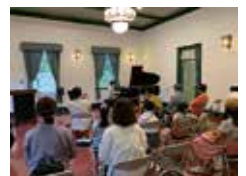
セプテンバーコンサート